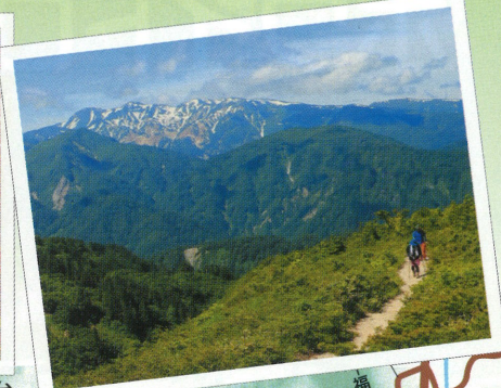
9 三方岩岳から望む白山