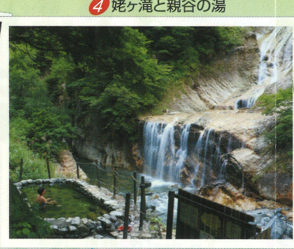
4 姥ヶ滝と親谷の湯